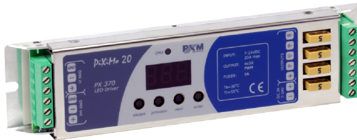
PiXiMo 20 LED driver 4x5A OC