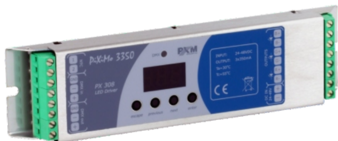
DixiMo 3350 LED driver 3x350mA/48V