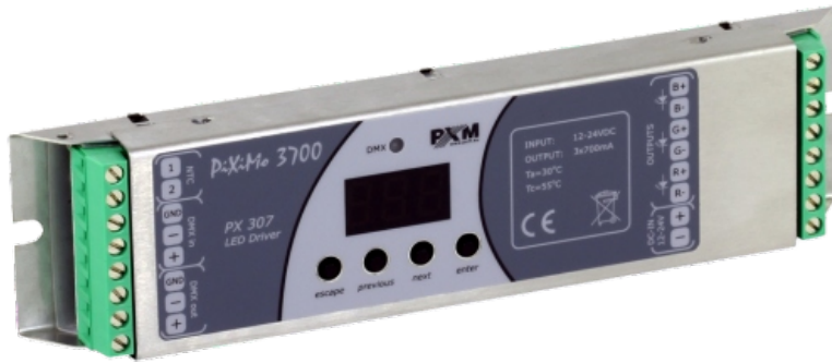
PiXiMo 3700 LED driver 3x700mA