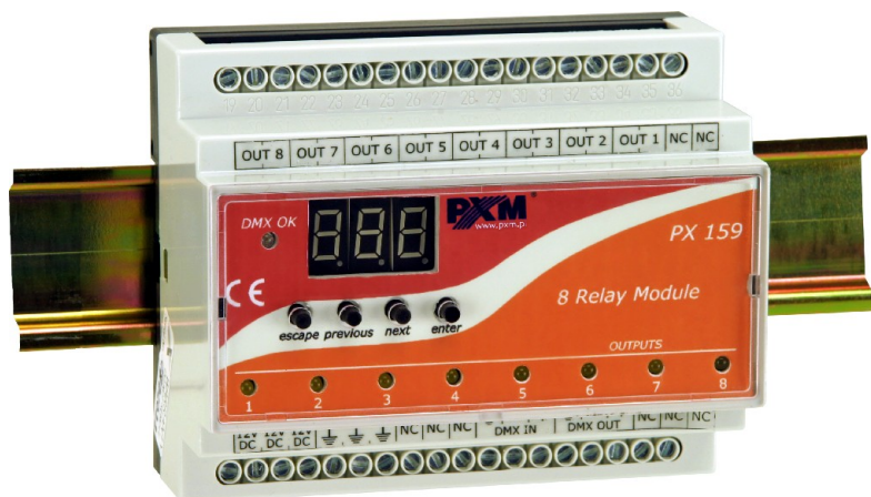
8 Relay Module