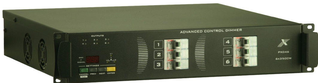
AC Dimmer 6 x 3500 W